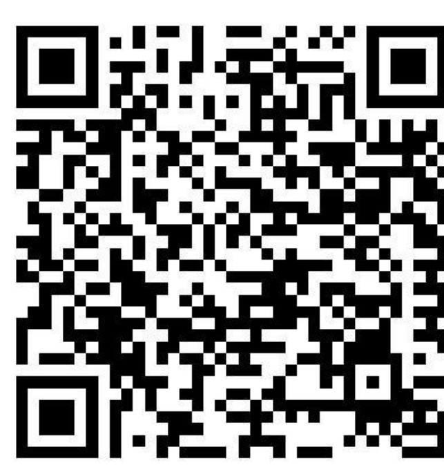
**Corona-Regelungen in den Bundesländern

Hotlines zum neuen Coronavirus Bundesministerium für Gesundheit: 030 346 465 100 Unabhängige Patientenberatung Deutschland: 0800 0117722 Patientenservice: 116 117