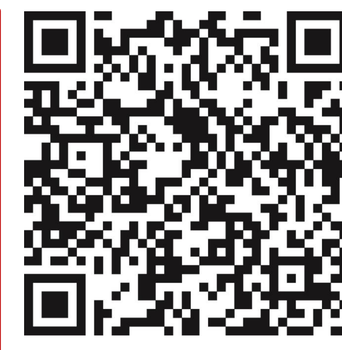
Weitere Informationen BZgA